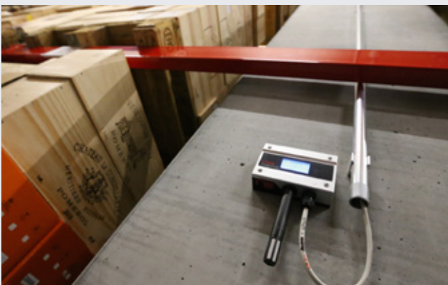
Die Rotronic-Fühler HygroFlex HF 135-AB1X.

Warum wurde Rotronic anderen Unternehmen vorgezogen? «Es handelt sich um ein seriöses Unternehmen, das im Bedarfsfall sofort eingreift. Die Fühler müssen unbedingt zuverlässig und präzise arbeiten, denn sie liefern alle Informationen über die klimatischen Bedingungen im Gebäude», erklärt der technische Direktor. Daher die Wichtigkeit der Messungen.