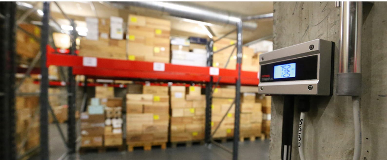
Einer der 227 Rotronic HygroFlex Messumformer im Zollfreilager Ports Francs.

Unser Land verfügt über rund ein Dutzend Zollfreilager, Transitzonen für die Lagerung von Waren, deren Hauptvorteile die temporäre Aufhebung der Zollrechte und der Steuern sind. Sie profitieren neben einer Lage im Herzen Europas auch von einer rechtlichen und politischen Stabilität. Das Unternehmen Ports Francs et Entrepôts de Genève SA, an dem der Kanton Genf 87 % der Anteile hält, ist in La Praille ansässig, wo es eine Gebäudefläche von 150000 m 2 verwaltet, die Hälfte davon unter schweizerischem Regime (zollfrei). Das Unternehmen verfügt außerdem über Lagerflächen (10000 m 2 ) in der Frachthalle des internationalen Genfer Flughafens.