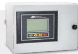
Kein regelmässiges Nachfüllen oder Ersetzen des Elektrolyten