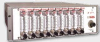
Geprüft und als lecksicher zertifiziert