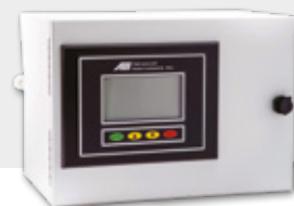
Nachweisgrenze (LDL) unter 2,5 ppb