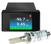
Easidew Advanced Online